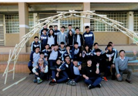
力學原理實作－達文西橋